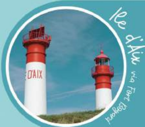
Île d'Aix via Fort Boyard

UN CADEAU EST INCLUS À BORD POUR LES ENFANTS*